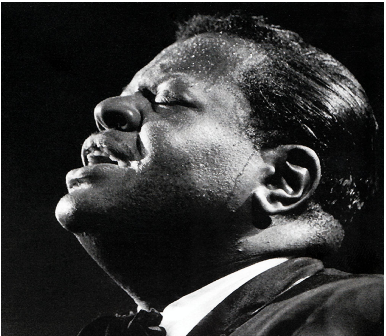
Durchgeistigt: O. Peterson in Dänemark, 1964

PS: Wird sich bitte endlich einmal irgendjemand in Dänemark aufmachen, um uns das gesamte Holbaek-Konzert zu schenken! Bitte!